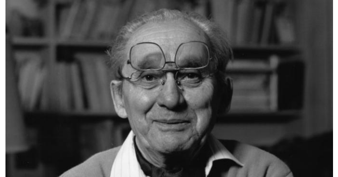
Dimanche 12 janvier 2014

09h30 Accueil et répartition des chambres 10h00 Ouverture et présentation des participants